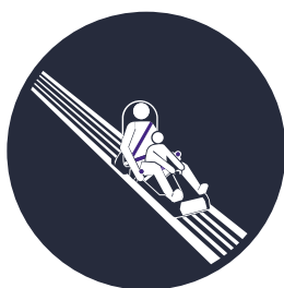
Povinnost připoutat se!